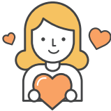
사회복지 종사자 사회복지 전담 공무원